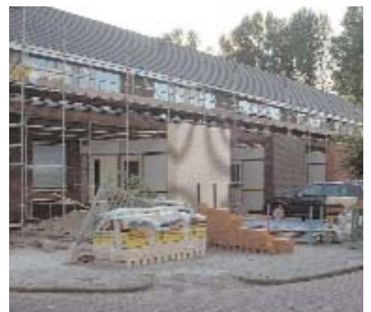
Gevelrenovatie aan de Buitenhof in Swifterbant

Medio maart is OFW gestart met gevelmodernisering aan de Buitenhof in Swifterbant en aan de Kruizemunt in Dronten. Hieraan zijn diverse besprekingen bij OFW aan vooraf gegaan met de architect, aannemer, bewonerscommissieleden en een coördinator of bestuurslid van de Huurdersvereniging. De gevels hebben een frisse uitstraling gekregen en ook aan isolatie van de woningen is gedacht. Het unieke is, dat de bewoners zelf de kleuren van de muurtjes (Buitenhof) of gevels (Kruizemunt) en houtwerk mochten kiezen. Een palet van diverse kleuren was hiervoor beschikbaar. In de Kruizemunt is de achtergevel op de begane grond opgefrist door nieuw metselwerk en aan de Buitenhof zijn voor de bestaande bergingen gekleurde muurtjes geplaatst. De entree heeft hier ook een andere indeling gekregen. Daarnaast zijn de woningen veiliger gemaakt door nieuw hang- en sluitwerk. De woningen voldoen nu weer aan de eisen van deze tijd en kunnen er voorlopig weer vele jaren tegen. Ook is er inspraak geweest betreft het sociaalplan over de vergoedingen.